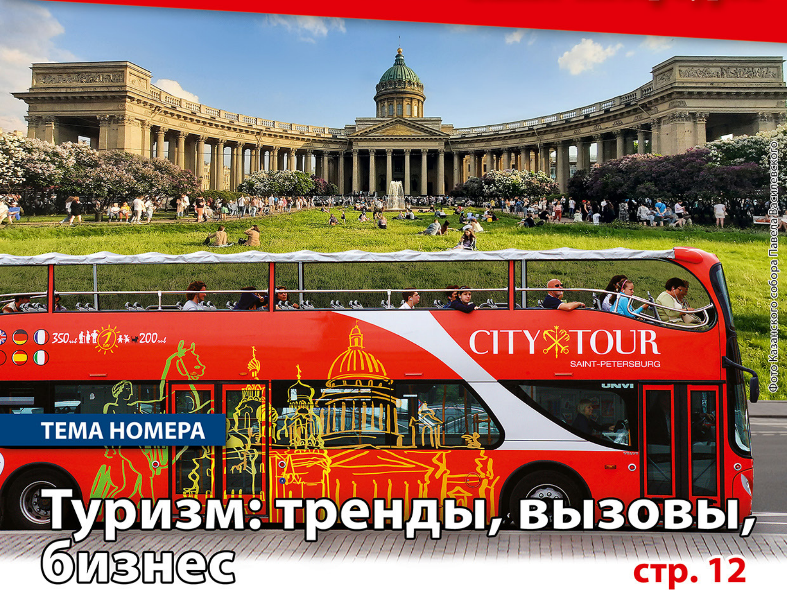
Фото Казанского собора Павела Васильевского