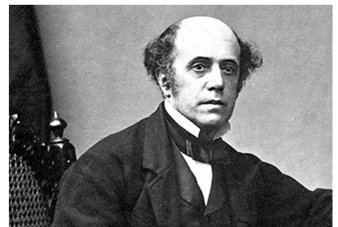
Томас Кук (1808 – 1892) – британский предприниматель. В 1841 году открыл первое в истории туристическое агентство

появление массового транспортного средства – железных дорог. Томас Кук начал активно использовать открывшиеся возможности. Когда в 1851 году в Лондоне состоялась первая Международная промышленная выставка, только из Йоркшира им была организована отправка 165 тыс. посетителей. В 1854 году в Англии издается первый справочник по гостиницам, адресованный путешественникам и туристам. В нем было указано около 8 тыс. гостиниц.