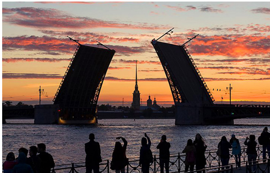
Пик туристического сезона в Санкт-Петербурге – период белых ночей

Власти Санкт-Петербурга ожидают, что в 2022 году город посетят