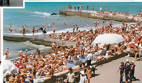
Сочи 1964 год ▶